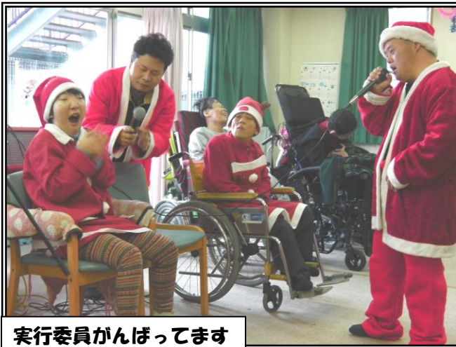
実行委員がんばってます