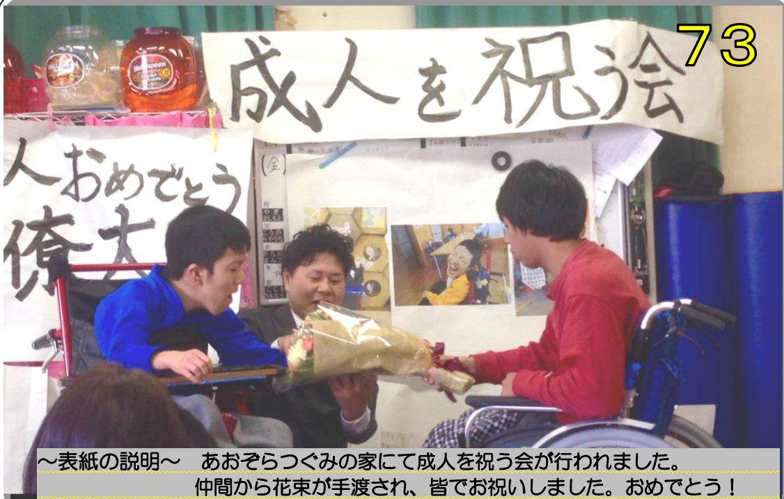
～表紙の説明～ あおぞらつぐみの家にて成人を祝う会が行われました。 仲間から花束が手渡され、皆でお祝いしました。おめでとう！

社 会 福 祉 法 人 あおぞらつぐみ福祉会 あおぞらつぐみの家発行 〒578-0901 東大阪市加納5-12-25 ☎ 072-872-9211 Fax 072-872-9212 発行責任者 紺谷 護