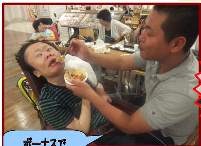
ボーナスで ランチにきました