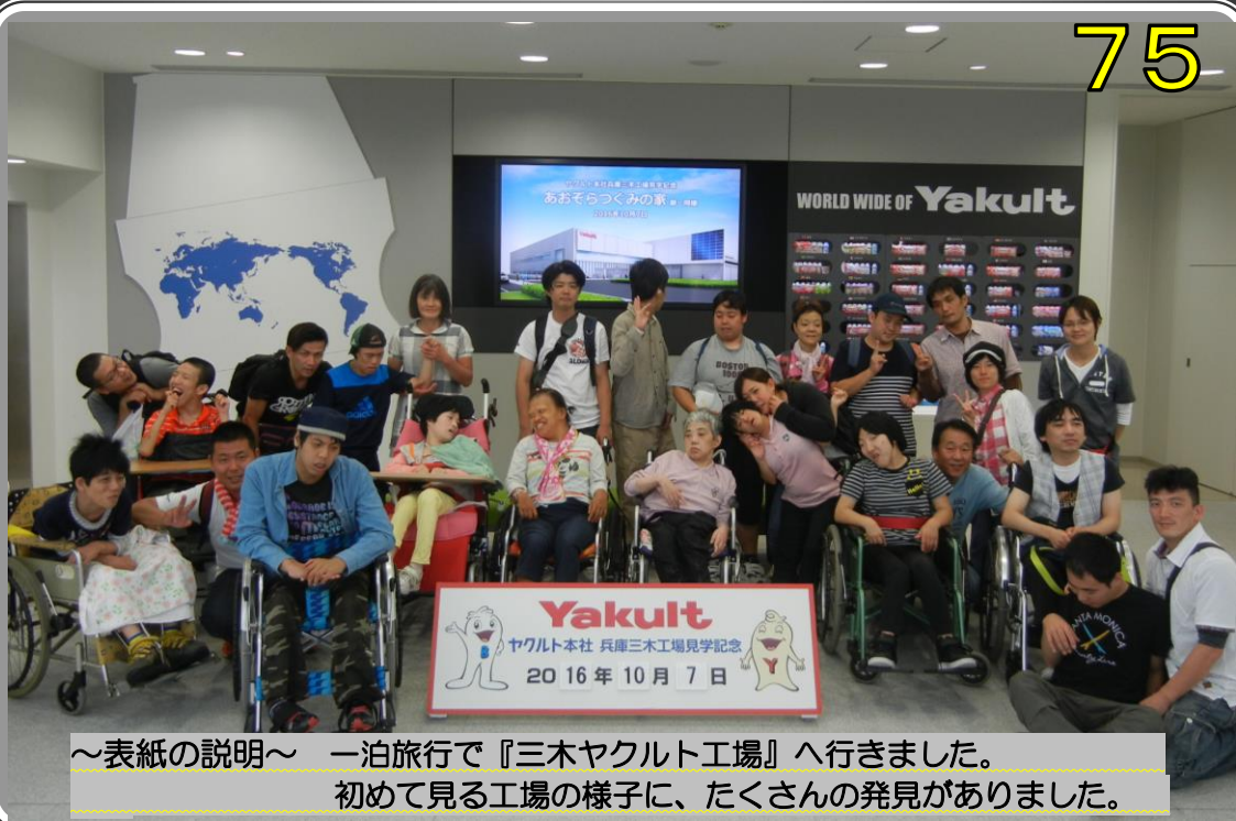
～表紙の説明～ 一泊旅行で『三木ヤクルト工場』へ行きました。 初めて見る工場の様子に、たくさんの発見がありました。