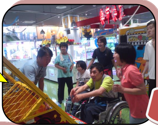
イオンでゲーム がんばれ～

短い時間でしたが、お盆休み明けから再スタートを切るための良い取り組みになったでしょう。 (浦本)