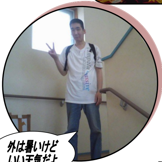
外は暑いけど いい天気だよ