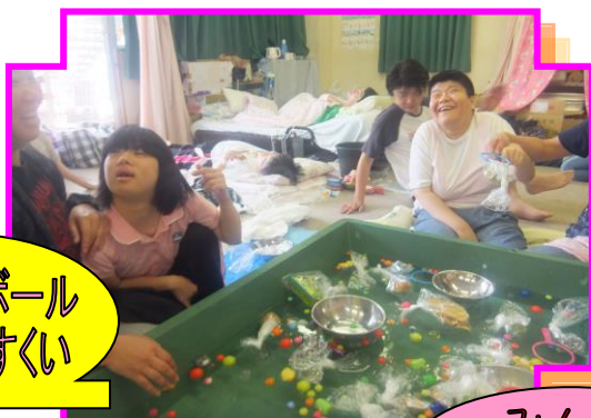
スーパーボール &お菓子すくい