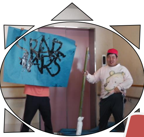
大きな紙で 豪快に書初め

忙中閑ありで、週末のレクでは山のおいしい空気を吸いにも出かけました。 仲間の交流会・クリスマス会の実行委員に選出された仲間も大いに力を発揮し、当日は大盛況でした☆ 本年も1班2班の仲間はますます元気に楽しい日々を過ごして参りまーす♪ (薦田)