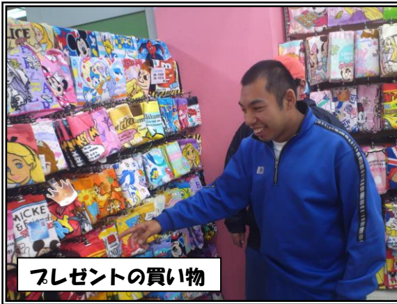
プレゼントの買い物