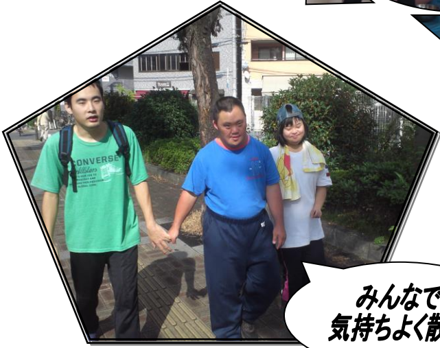
みんなで 気持ちよく散歩