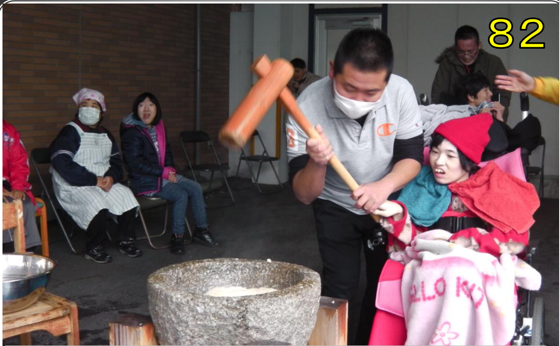
～表紙の説明～ みんなでお餅つきをしました。今年もよい年になりますように。